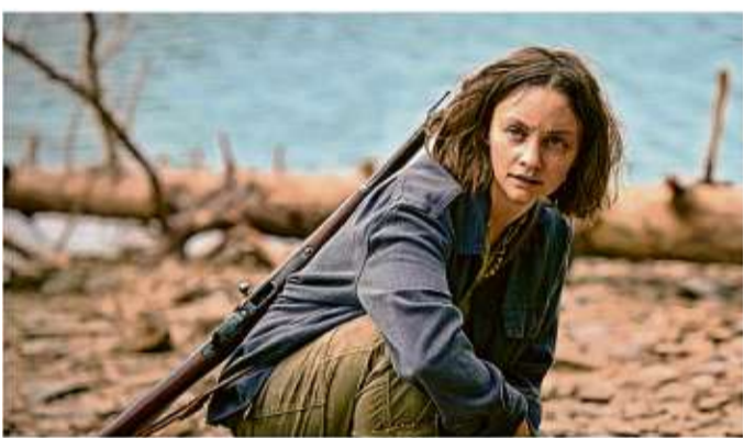
Skalde ist im Dorf eine Außenseiterin, nachdem sie mit ihrer Mutter ein fremdes Kind aufgenommen hat.

Eines Tages steht das Kind plötzlich da, die Haare feuerrot leuchtend inmitten des Kiefernwaldes, und gehört niemandem. Skalde nimmt es mit zu sich, obwohl sie weiß, dass die anderen, die in der abgelegenen Gegend leben, das nicht dulden werden. Skalde und ihre Mutter Edith gehörten selbst nie richtig zur Gemeinschaft, seit Edith vor mehr als zwei Jahrzehnten plötzlich triefend am Ufer des Flusses stand, von dem die Anderen sich erhofft hatten, er würde sie vor der im Chaos versinkenden Welt beschützen. Skalde ist seit jeher darum bemüht, das Stigma, das auf ihrer Mutter Edith liegt, zu überwinden und von der Dorfgemeinschaft akzeptiert zu werden. Während ihr Wunsch, dazugehören, Mutter und Tochter auseinandergetrieben hat, ist Skalde der Schützling des Dorfvorstehers und langsam ein geachtetes Mitglied der Ge-